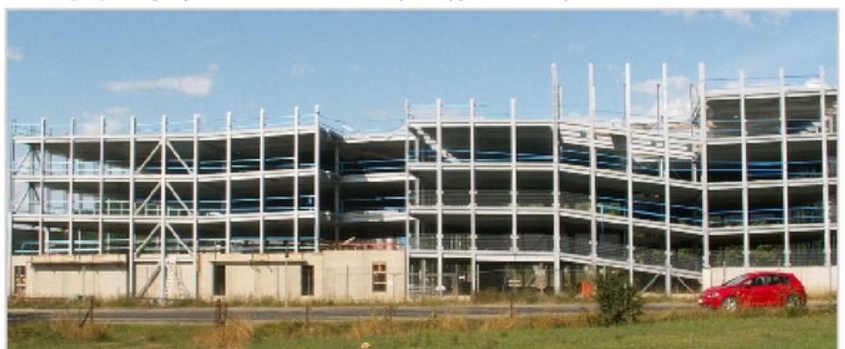
540 miejsc parkingowych dla La Provençale: duży zasięg, lekkość, szybkość

Wybierając stal, La Provençale, spółka zajmująca się dystrybucją żywności, mająca swoją siedzibę w Luksemburgu zyskała tym samym 500 miejsc dla samochodów osobowych i 40 miejsc dla samochodów ciężarowych (na parterze). Zaledwie siedem miesięcy prac budowlanych i ograniczenie do minimum